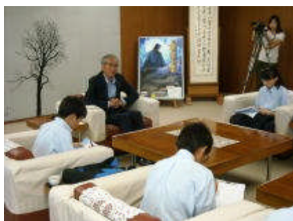
1年生上越の偉人へのインタビュー

当校は、 世界で活躍できる人材の育成 を目指す学校であり、そのためにも大学進学に力を入れています。しかし、知識だけあっても世界に活躍できる人材にはなり得ません。豊かな心や健やかな身体、社会性を身に付けることが重要です。そこで当校では、中高一貫教育校のメリットを最大限活かし、他の一般校ではできない特色ある体験活動や宿泊行事を行っています。以下は、当校の特色ある行事の一部です。