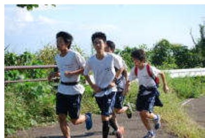
チャレンジウォーク 37 km