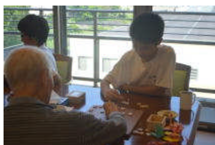
2年生福祉一日体験