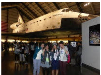
4年生海外研修(アメリカ)