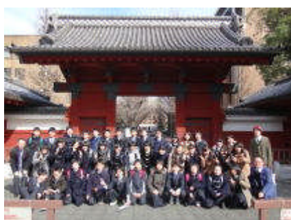
1年生東京大学訪問(東京)