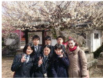
2年生修学旅行・京都大学訪問(関西)